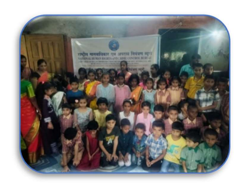
N H R C C B MONTHLY REPORT September, 2024

NHRCCB Teacher Inspiration awarded to three teachers at Parjhai Vasundhara Vidyapeeth Ashram School in Dadra Nagar Haveli on the occasion of Teachers Day on 5th September.NHRCCB Valsad branch celebrated teachers day program in Danah (D&NH).