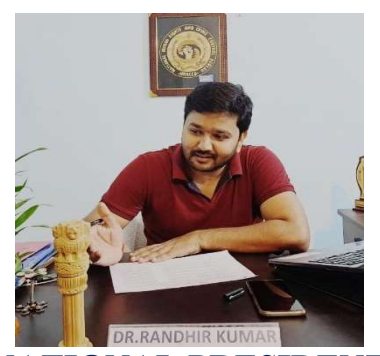
NATIONAL PRESIDENT NHRCCB