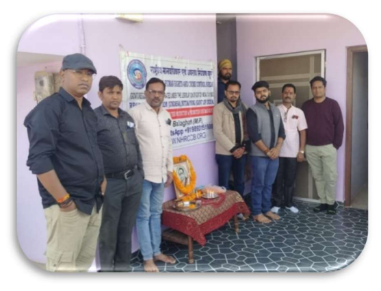
occasion of Constitution Day

National Human Rights and Crime Control Bureau District Balaghat Team celebrated today as Constitution Day by NHRCCB officials and members at Tehsil Block Lalbarra in Gram Panchayat Amoli on 26th November Constitution Day 1949 was prepared by Dr. Bhimrao Ambedkar Prepared by it took 2 years 11 months 18 days to make it implemented on 26 January 1950 we all have got the right to equality right to morality and freedom on this programme you all Hearty wishes to all the people of the country on the