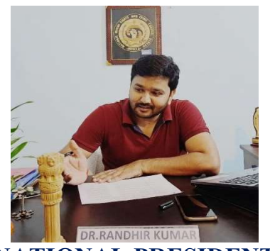
NATIONAL PRESIDENT NHRCCB