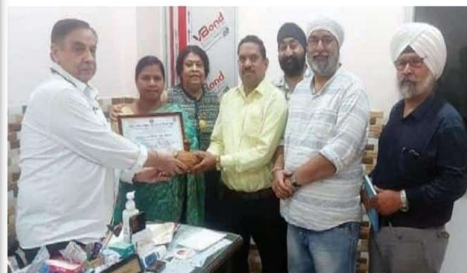
जांजगीर-चांथा » दलंग रिपोर्टर

राष्ट्रीय मानवाधिकार अपराध निवन्त्रण ब्यूरो छत्तीसगढ़ टीम द्वारा मानव अधिकारों की रक्षा के लिए योजना अनुरूप कार्य किया जाता है, समय समय पर उत्कृष्ट कार्य करने वालों का भी सम्मान किया जाता है, इसी परिप्रेक्ष्य में विश्व स्वास्थ्य दिवस पर शिशु रोग विशेषज्ञ जिनके पास दूर दूर से आकर सुविधा प्राप्त कर रहे और इस कार्य में मशहूर अपना महत्वपूर्ण योगदान देने वाले