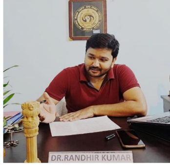
NATIONAL PRESIDENT NHRCCB